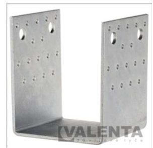
przykładowy wspornik słupa typu U (uchwyt ciesielski)