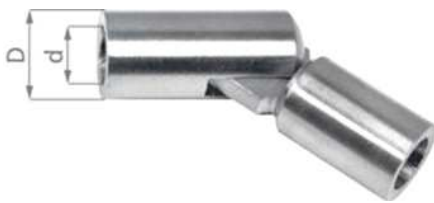
przykładowy łącznik przegubowy